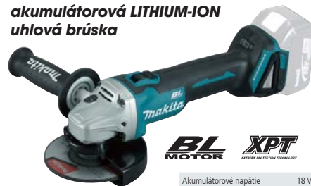
DGA506Z akumulátorová LITHIUM-ION uhľová brúška