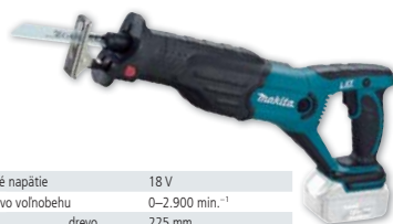
DJR181Z akumulátorová LITHIUM-ION chvostová píla