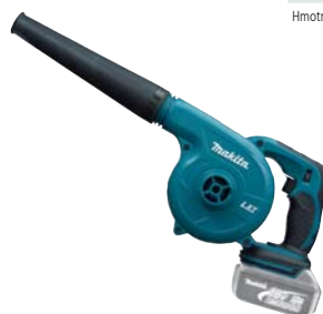
DUB182Z akumulátorové LITHIUM-ION dúchadlo