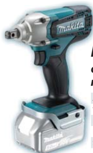
DTW190Z akumulátorový LITHIUM-ION rázový uťahovač