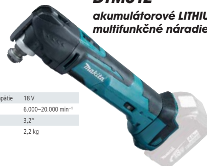
DTM51Z akumulátorové LITHIUM-ION multifunkčné náradie