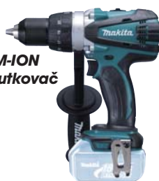
DDF458Z akumulátorový LITHIUM-ION 2-rýchlostný vrtací skrutkovač