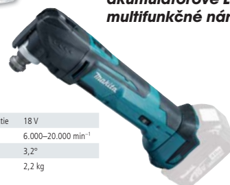
DTM51Z akumulátorové LITHIUM-ION multifunkčné náradie