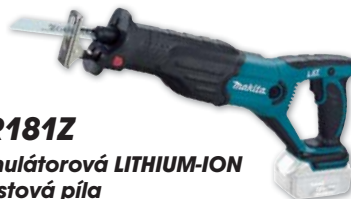
DJR181Z akumulátorová LITHIUM-ION chvostová píla