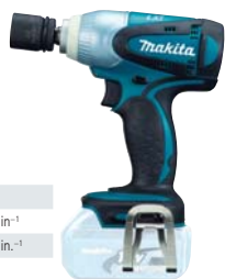
DTW251Z akumulátorový LITHIUM-ION rázový uťahovač