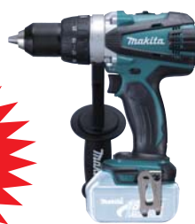
DDF458Z akumulátorový LITHIUM-ION 2-rýchlostný vŕtací skrutkoč