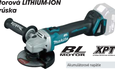
DGA506Z akumulátorová LITHIUM-ION uhlová brúska