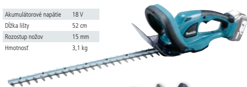
DUH523Z akumulátorový LITHIUM-ION plotostrih