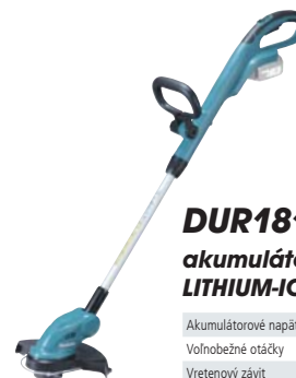
DUR181Z akumulátorový LITHIUM-ION výžinač