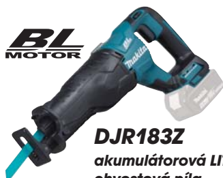
DJR183Z akumulátorová LITHIUM-ION chvostová píla