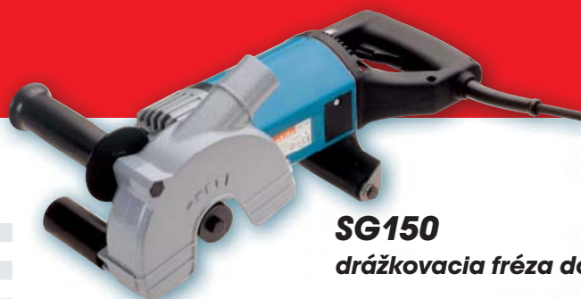
SG150 drážkovacia fréza do muriva