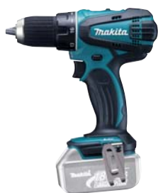
DDF456Z akumulátorový LITHIUM-ION 2-rýchlostný vrtací skrutkovač