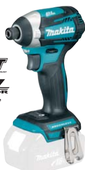
DTD154Z akumulátorový LITHIUM-ION rázový uťahovač