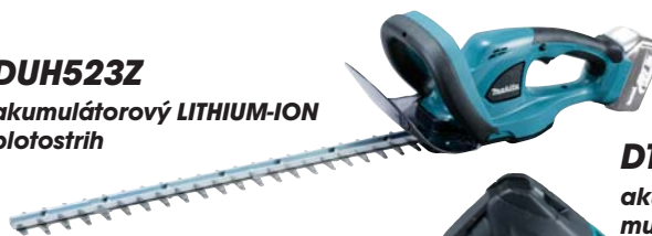
DUH523Z akumulátorový LITHIUM-ION plotostrih