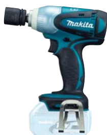
DTW251Z akumulátorový LITHIUM-ION rázový uťahovač