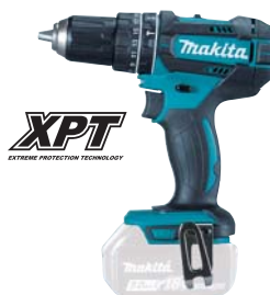
DHP482Z akumulátorový LITHIUM-ION 2-rýchlostný vrtací skrutkovač s príklepom